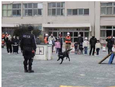
▲救助犬による救出訓練