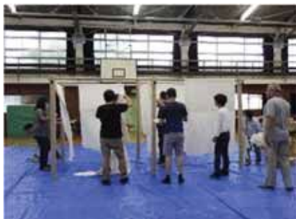
▲間仕切り設置訓練 (秋葉台小学校)