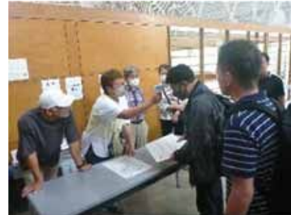
▲避難者誘導訓練 (慶應義塾大学)