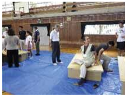
▲段ボールベッド組み立て訓練 (秋葉台中学校)